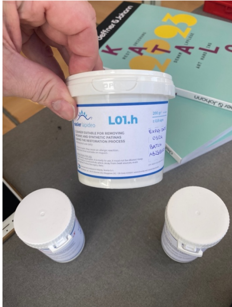
Produkter från Nasier.

Utöver föredrag och technical visits, fanns även en Trade fair på campus UPV där utställare visade nya material, maskiner och utrustning relevant för konservatorbranschen. Under kafferasterna höll de även presentationer och demonstrationer man kunde välja att gå på. Jag valde bl.a. att gå på en sådan där Deffner & Johann visade hur nanorestore gel och produkter från Nasier kan användas på målningar.