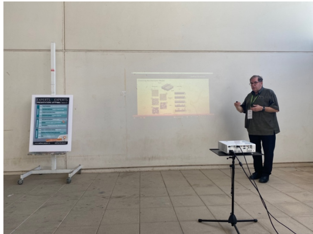
Demonstration av nanogeler hos Deffner & Johann.

Konferensens sista kväll hölls den traditionella konferensmiddagen som var mycket trevlig.