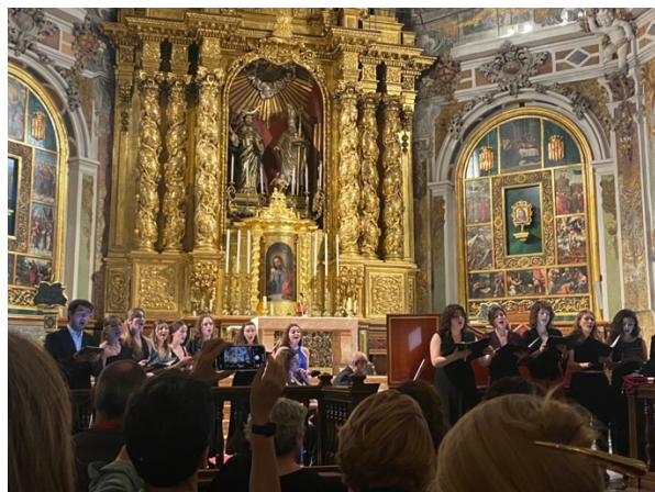
Studentkonsert i San Nicolas.