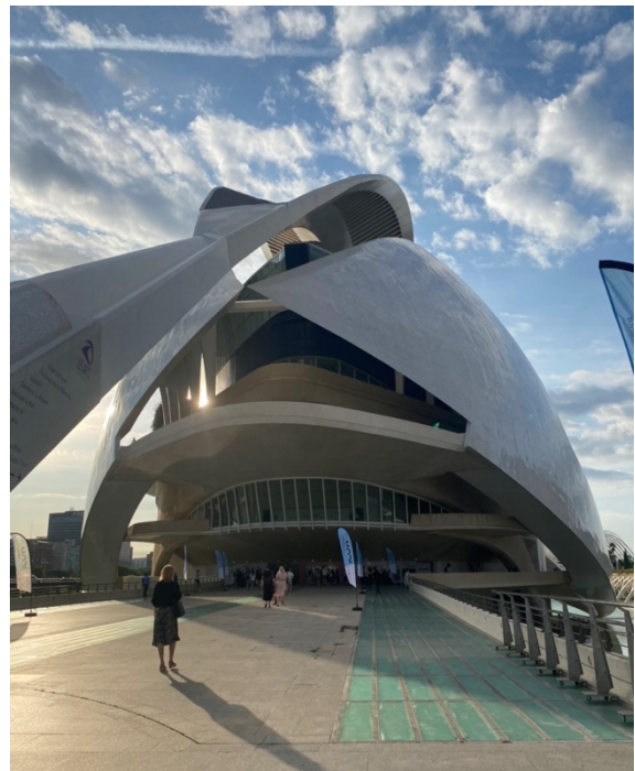
Det vackra Palau de les Arts där konferensen inleddes.

Dag 2,3 och 4 av konferensen, hölls på olika platser på campus av Universitat Politècnica de Valencia.