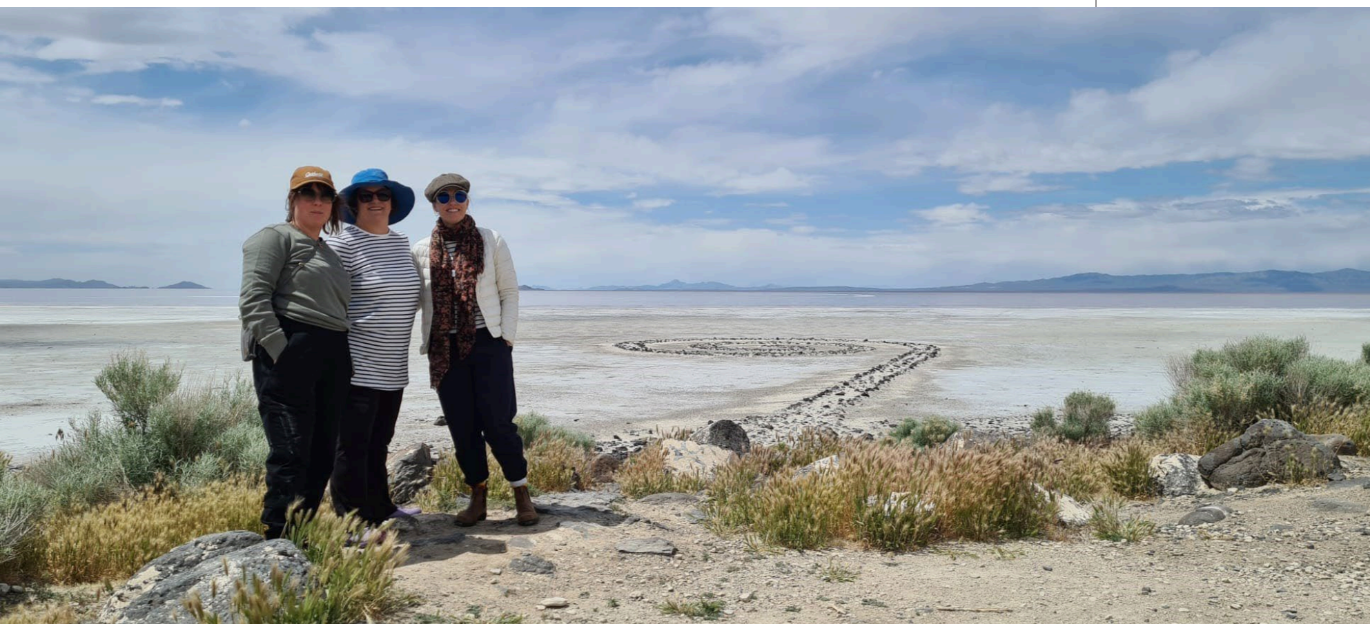
Besök på konstverket Spiral Jetty med nyfunna vänner.