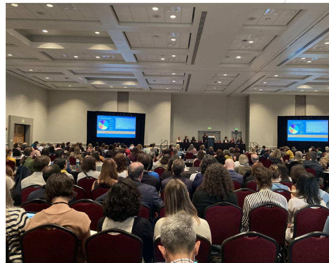
Fullsatt publik på en förmiddag som handlade om att underlätta övergången från att gå från nyexaminerad till etablerad i yrket.