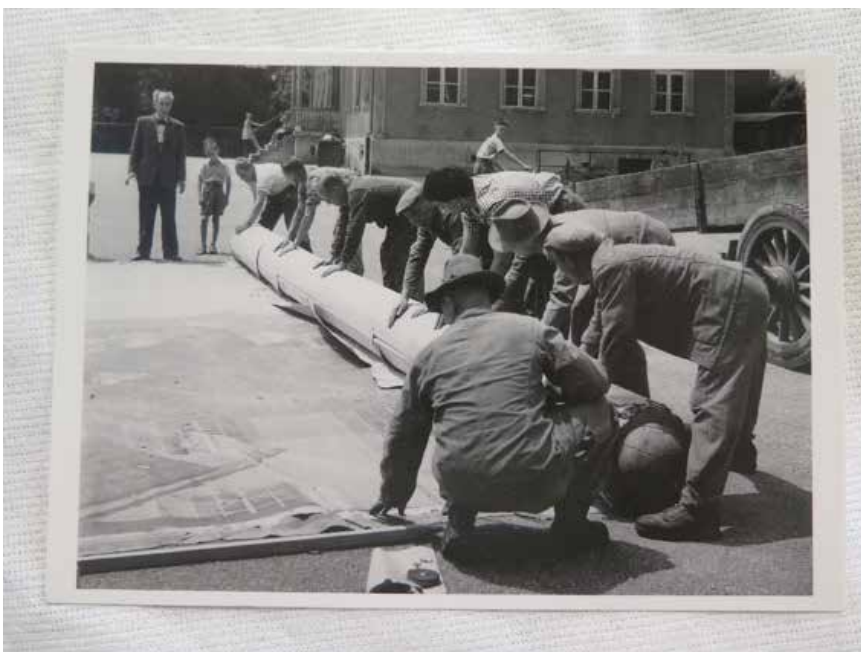
Marquard Woche's Panorama från Thun.