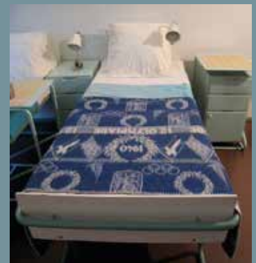
På sjukhuset finns en så kallad museisal kvar, ett patientrum som är bevarat i sitt ursprungliga skick. Lägg märke till filten på sängen. Den specialgjordes till olympiaden som skulle ha gått av stapeln i Helsingfors om det inte hade varit för kriget. De fick vänta till 1952 istället.

Text: Lisa Nilsen lisa@lisanilsenkulturvard.se