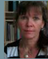
FORMGIVNING Annica Björklund