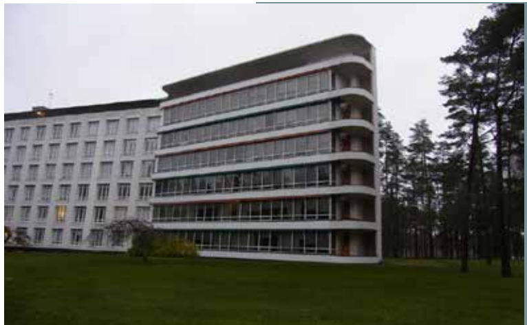
Ena flygeln på sjukhuset i Paimio nära Åbo, ritat av Alvar Aalto. Balkongerna var från början öppna. Där låg patienter med tuberkulos utomhus för att andas frisk luft.