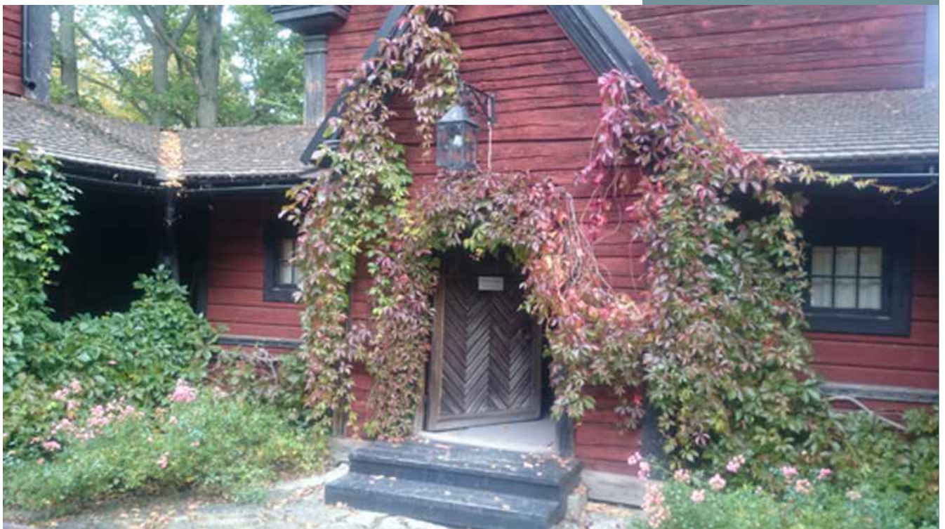
Skansenkyrkan i höstskrud.