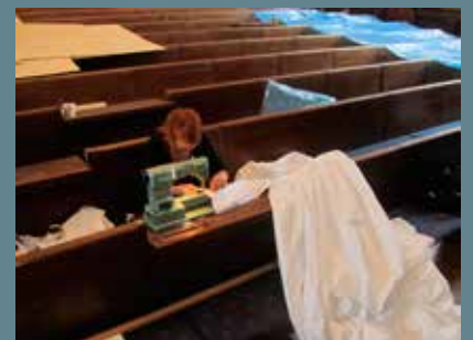
Arbete med baksidesskydd.