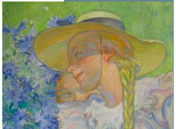
Detalj av målningen.