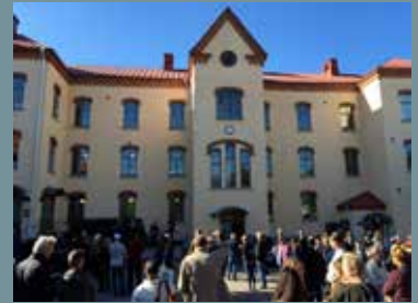
Byggnadsvårdens konvent lockade 400 deltagare till Mariestad under tre dagar.

Det är en utmaning att arrangera ett så här stort konvent. Logistiken på så många platser med teknisk utrustning samt mentorer blir hårt provad och det blir tidspressat, inte minst då 400 deltagare ska ha förtäring samtidigt. Det är också en utmaning att lägga ett så stort konvent i en stad som kanske inte har 400 lediga hotellrum. Men på något sätt löste sig detta också. Jag såg ingen som tältade i alla fall.