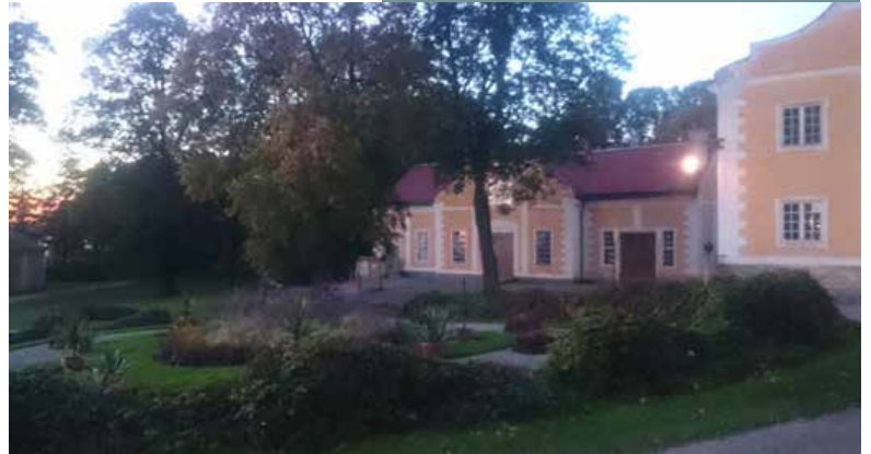
Julita i solnedgång.

Den kulturhistoriska miljön stod Julita gård vid sjön Ölajaren för. Julita gård är Nordiska museets herrgårdsanläggning i Södermanland och miljön visar hur ett storgods fungerade och såg ut i början av 1900-talet. Alla kursdeltagare; samlingsförvaltare, städansvariga, konservatorer och antikvarier från den privata sektorn, Svenska kyrkan, kommunal och statlig verksamhet, kunde övernatta på Julitas vandrarhem eller i rum tillhörande herrgården. Kursens syfte var att ge en bra grund i förvaltningen av kulturhistoriska byggnader med samlingar och innehöll både teori och praktiska övningar. Den teoretiska delen innehöll skadedjursidentifiering och samordnad skadedjurskontroll, housekeeping – städning och förebyggande åtgärder, mögel och svamp, identifiering och förslag till åtgärder. Den praktiska delen genomfördes i Julitas historiska miljö och utifrån de