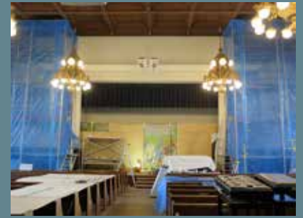
Aulan i Hvitfeldtska gymnasiet.