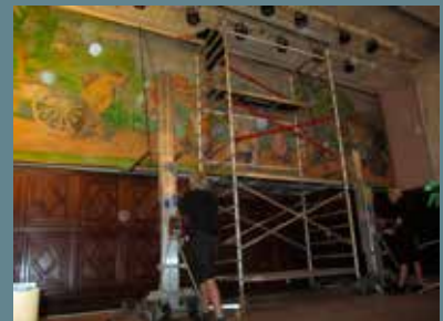
Målningen placeras tillbaka på sin plats.