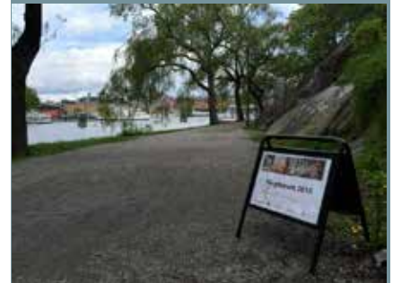
Färgforum på Skeppsholmen.