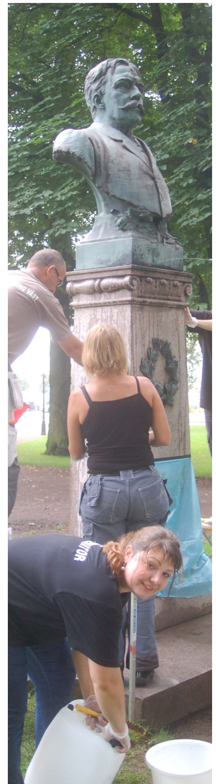
Viktor Rydberg, placerad i Rådhusparken. Rengöring av byst samt försök till borttagning av klotter på piedestal.

Vägen från idé till genomförande var långt ifrån rak. Åtskilliga kontakter togs, både per e-post och per telefon med allt från de höga cheferna på kommunens förvaltningar till "fotfolket". Men för att inte gå händelserna i förväg – det började med att jag fick kontakt med en reporter på Sveriges Radio P4 Jönköping där jag gav en intervju och kort presentation av projektet i jakt på sponsorer som kunde tänka sig att "adoptera en skulptur". I utbyte skulle de få sitt namn eller logotyp intill