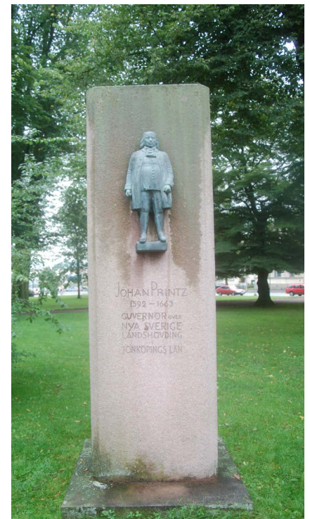
Johan Printz, placerad i Rådhusparken, Jönköping. Kraftig påväxt på sockel.

Material i form av stegar och slangar skulle kommunen ordna, samt en större bil för transport av detsamma mellan skulpturerna. "Inga problem!", sa cheferna. "Vi har inga stegar, inga slangar, inga hinkar och tillgång till vatten har vi inte heller", sa "fotfolket" och avslutade meningen - "men vi har skylift och traktorer med vattentunnor på släpet men de är bokade till oktober, det är ju säsong nu, vet du." I mitt stilla sinne undrade jag för ett ögonblick om det verkligen var en kommun jag hade kontakt med?!