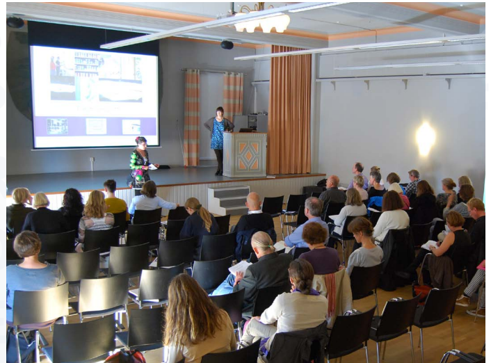
Färgforum ägde i år rum på Dacapo i Mariestad.