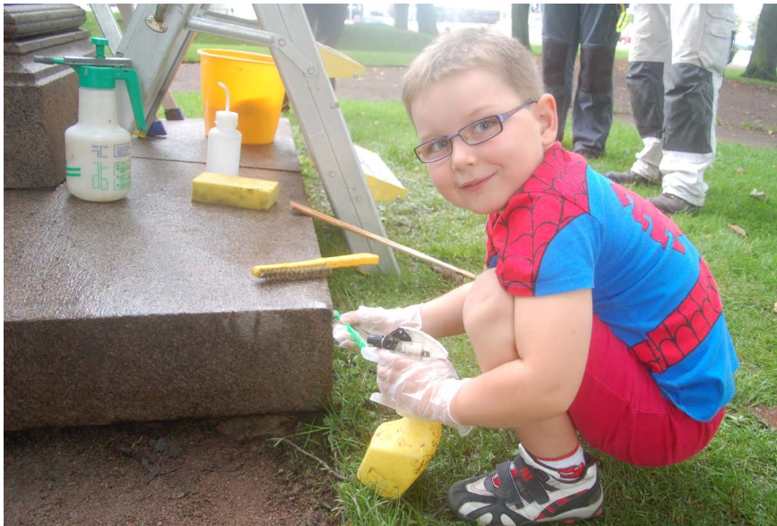
Nästa generations blivande konservator?

Nåja, skämt åsido det hela löste sig väldigt bra med lite ansträngning, flertalet samtal och mycket goodwill från kulturkansliets sida och hela fyra stegar fanns vips på plats. Det visade sig att universallösningen hette vaktmästare och att vatten fanns att hämta på stadsbibliotekets kafés uteservering, observera det mycket passande namnet, "Skulpturgården". Under arbetes gång fick vi än en gång Sveriges Radio på besök samt några sekunder i TV4 Jönköping. En hel del människor visade sitt intresse för vårt arbete och ställde sina frågor, eller som någon gjorde - undervisade oss i stadens historia. Det som ändå var störst för mig med detta projekt var den upplutning av klasskamrater som trots löfte om volontärarbete, såg möjligheten och avbröt sitt sommarlov för att de hade lusten att praktisera sina teoretiska kunskaper i detta samarbete mellan studenter och yrkesverksamma proffs.