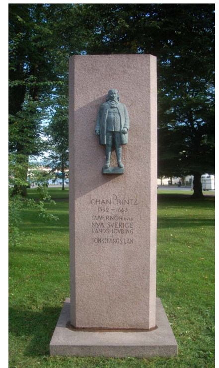
Efter rengöring med borstar och vatten.