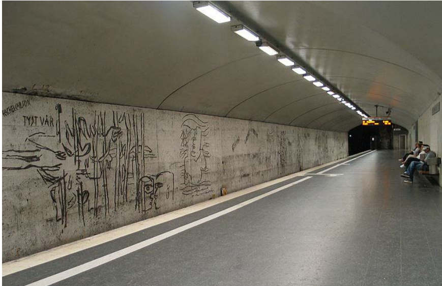
Siri Derkerts offentliga utsmyckning vid Stockholms tunnelbanestationen Östermalmstorg. Foto: Jonas Bergsten, 2005.

Under 2011 pågår ett forskningsprojekt vid Statens konst- råd med namnet Förvaltning av offentlig byggnadsanknuten konst i offentlig och privat ägo. Projektet syftar till att ana- lysera och bedöma vilken kompetens och vilka ekonomiska resurser som fordras för att långsiktigt vårda och bevara den offentliga konsten som är beställd under 1900-talet av staten, landsting och kommuner och som idag bland annat ägs av privata fastighetsbolag.