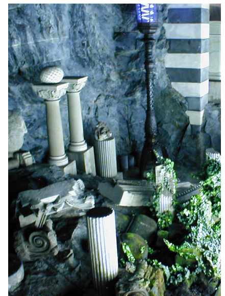
Detalj av den offentliga utsmyckningen 'Kungsträdgården', Stockholms tunnelbana.

Andra frågor har gällt konstverkets vård: om konstverket på något vis är dokumenterat och inventerat – och hur ofta det i så fall brukar ske, om en specifik vårdplan upprättats, om verket tidigare är konserverat och vem som i så fall utförde konserveringen. Slutligen har frågor gällt och vilka kontakter fastighetsägaren har haft över tid med antikvariska myndigheter, konservator eller konstnär(er).