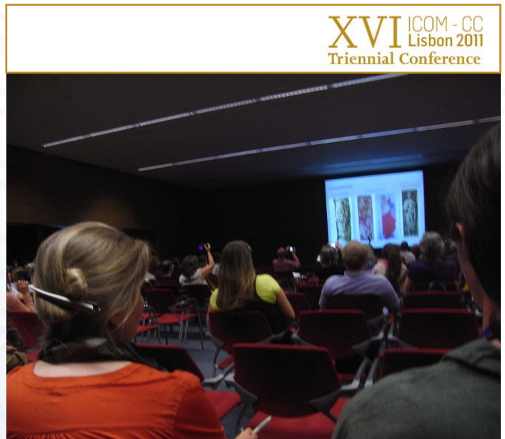
Det blir vanligare och vanligare att konferensdeltagare tar foton på stordisbilderna istället för att ta anteckningar.

Several papers took up the issue of the potential conservation education programs have to inform and inspire the communities around them to promote the preservation of cultural heritage. For example, Gutierrez et al. (Connecting conservation education to academic, public, and allied communities), Graves (Common sense: the conservator's role in helping to maintain multi-sensory access to objects for an ageing population) or Moreaux and Broers (Une base de données pour améliorer la conservation des œuvres contemporaines conservées dans les lycées en région Rhône-Alpes. Un projet expérimental et formatif).