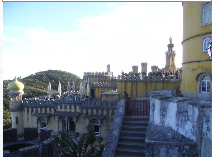
En av post-conference-utflykterna gick till det fantastiska palatset i Sintra utanför Lissabon. Ett bröllop firas på terrassen.

XVI ICOM-CC Lisbon 2011 Triennial Conference