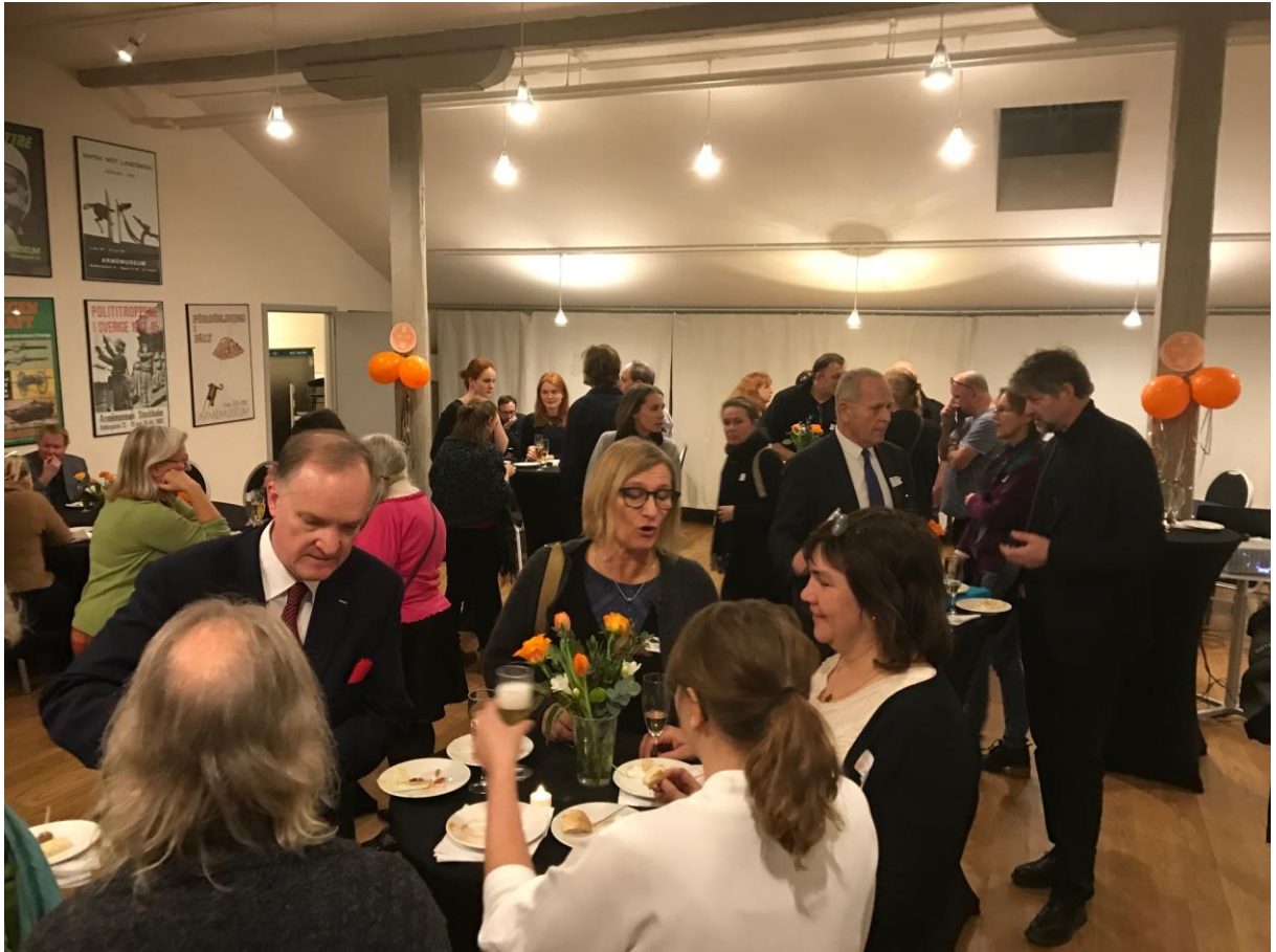
I vimlet under kvällsminglet

Dagen avslutades med att Acta bjöd på bubbel och mycket tilltugg. Flera kollegor och vänner tillkom och stämningen var hög. Vi var trötta, men riktigt nöjda.