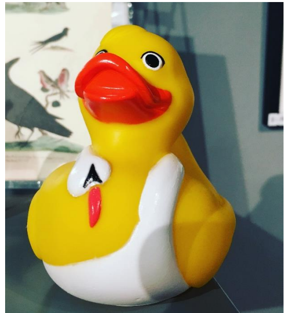
Under den historiska vandringen i Reykjavik hamnade jag i en museishop där denna blinkning till Björks gamla galaklänning hittades.

Dagarna var späckade med intressanta föredrag om 20 minuter vardera mellan kl 09.00 och 16.30. Två föredragsblock på förmiddagen respektive på eftermiddagen med avslutande diskussioner efter varje. Fredagen var endast en halvdag med föreläsningar. Efter lunchen så fanns det tre olika eftermiddagsexkursioner att välja på; Art history walk in Reykjavik, Historical Reykjavik och National Museum of Iceland.